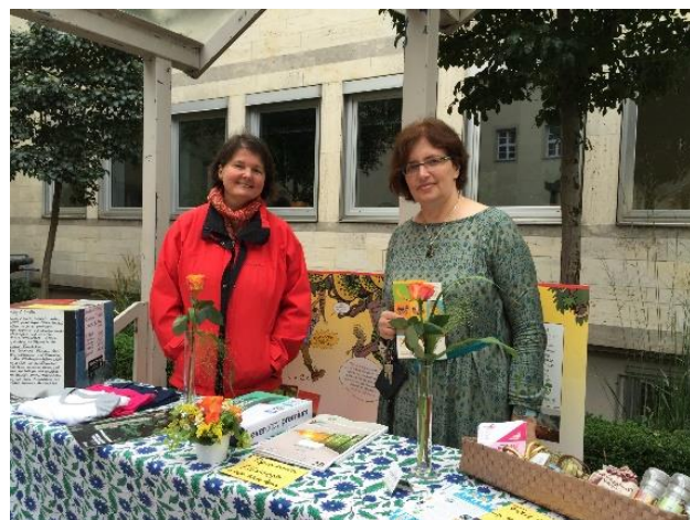
Faire Woche 2016