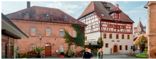
Stadtmuseum (14.10.2019,)

Der Kirchenbezirk lag bis zum Ende des 15. Jh.s außerhalb der Stadtmauern. Die Stadtpfarrkirche wurde bis 1341 an Stelle eines romanischen Vorgängerbaus errichtet; der stark eingezogene Chor weist ins 13. Jahrhundert zurück. Das Langhaus des gotischen Saalbaus wird von einem mächtigen hölzernen Tonnengewölbe überspannt. Bei der Restaurierung 1934/1935 wurde die Kirche wieder mit barocker Ausstattung versehen.