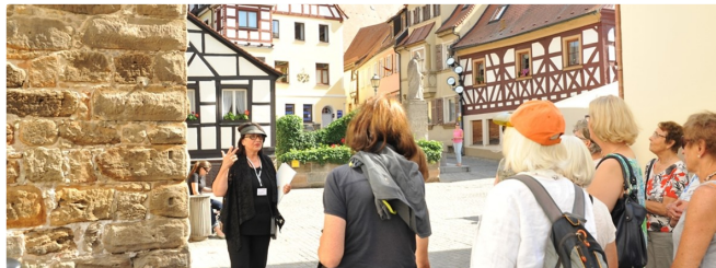
Stadtrundgang (14.10.2019, Stadt Herzogenaurach)

Kleine Gäste, große Entdecker: Für Kinder und Schulklassen gibt es spezielle Touren, die optimal auf die Bedürfnisse jüngerer Zuhörer abgestimmt sind. Neben gebuchten Gruppenführungen gibt es natürlich auch offene Führungen. Diese sind eine unkomplizierte Möglichkeit, auch ohne vorherige Anmeldung an ausgewählten Touren teilzunehmen. Im städtischen Veranstaltungskalender werden die Termine veröffentlicht.