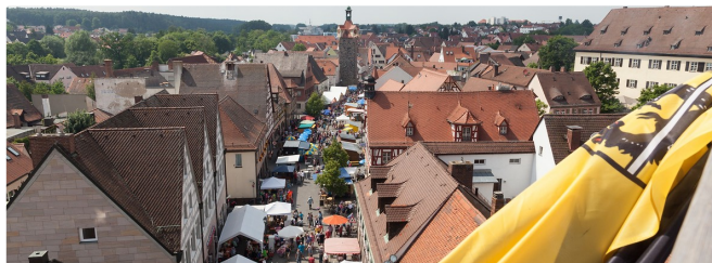
Ausblick (14.10.2019,)

E-Mail: tourist-info@herzogenaurach.de Internet: www.herzogenaurach.de