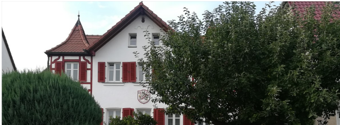
Dassler Haus (14.10.2019, Stadt Herzogenaurach)

Mit der Gründung der gemeinsamen „Sportschuhfabrik Gebrüder Dassler“ im Jahr 1924 begannen Adolf („Adi“) Dassler und Rudolf Dassler damit, den Sportschuh zu revolutionieren. In der Waschküche des 1900 errichteten Wohnhauses der Familie hatten die Söhne die ersten Schuhe genäht. Nach der Trennung im Jahr 1948 gründeten die Brüder die Weltkonzerne adidas und PUMA. Das Gebäude befindet sich in Privatbesitz.