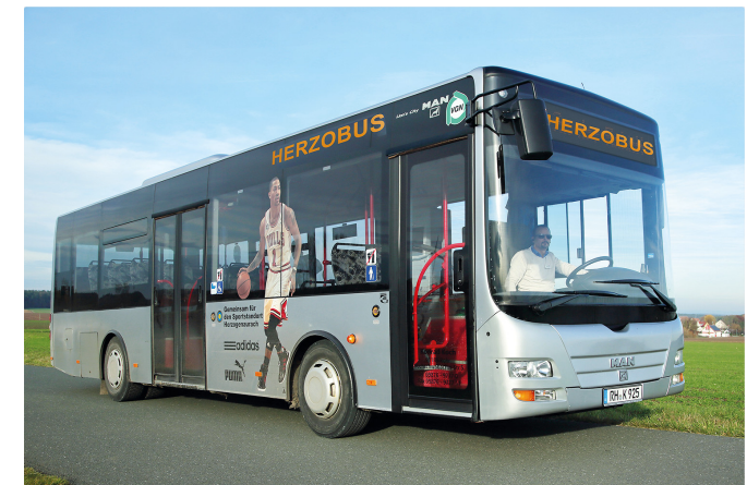
Herzo Bus (01.12.2019,)

Die Schnellbuslinie 200 bietet zusätzlich die Möglichkeit, von dem Busbahnhof „An der Schütt“ und verschiedenen Haltestellen direkt nach Erlangen (ZOB) zu gelangen.