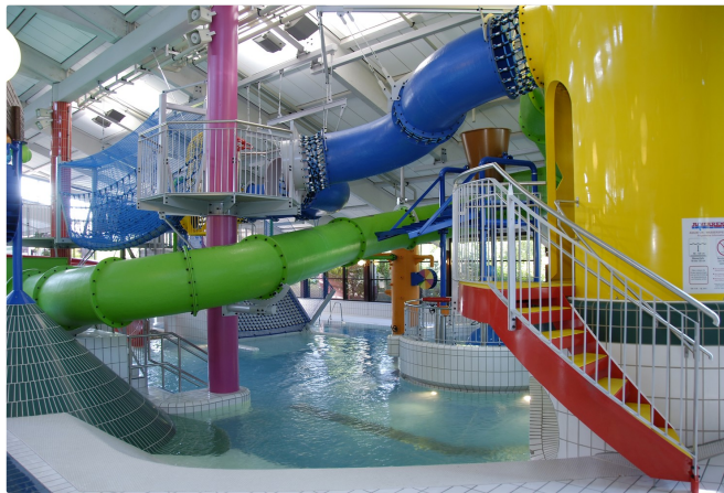
Atlantis innen (14.10.2019,)

E-Mail: info@atlantis-bad.de | Internet: www.atlantis-bad.de