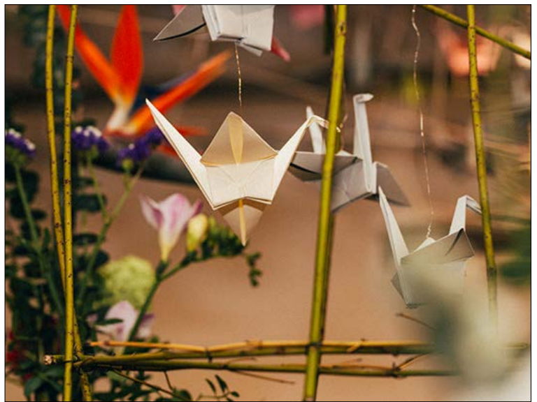
Origami-Kraniche in einem Herzogenauracher Geschäft – ein Symbol für den Frieden.

Wir möchten gut auf die Ankommenden vorbereitet sein und Informationen über bereitgestellte Unterkünfte bündeln. Diese werden dann ans Landratsamt Erlangen-Höchststadt weitergeleitet, das die Gesamtkoordination hat. Damit alle, die nach einer oft traumatischen Flucht zu uns gefunden haben, einen geschützten Raum, Ruhe und unsere Unterstützung erhalten können. Dafür brauchen wir Sie: Wenn Sie Zimmer oder Wohnungen für die Geflüchteten zur Verfügung stellen möchten, melden Sie sich bitte bei uns, entweder per E-Mail an rathaus@herzogenaurach.de oder unter Tel. 09132 / 901-902 (das Telefon ist zu den Öffnungszeiten des Rathauses besetzt).