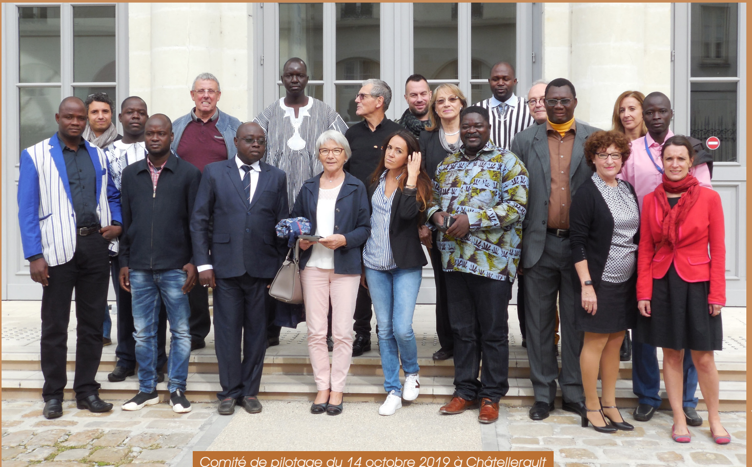
Comité de pilotage du 14 octobre 2019 à Châtellerauld avec l'ensemble des partenaires burkinabé, allemands et néo-aquitains