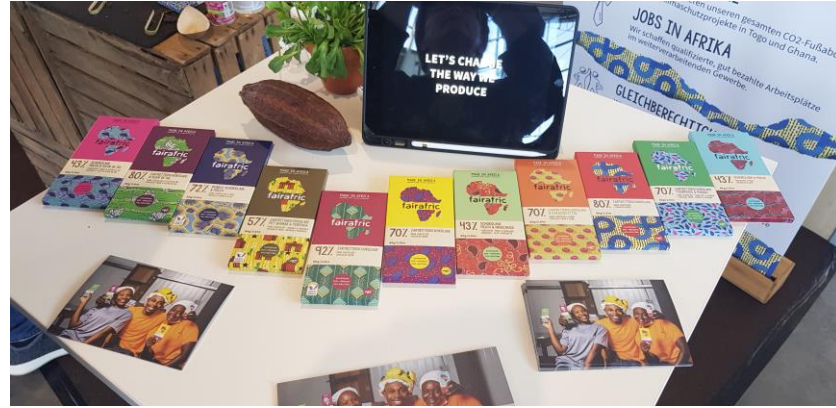
Am Stand sind viele Erzeuger selbst vertreten