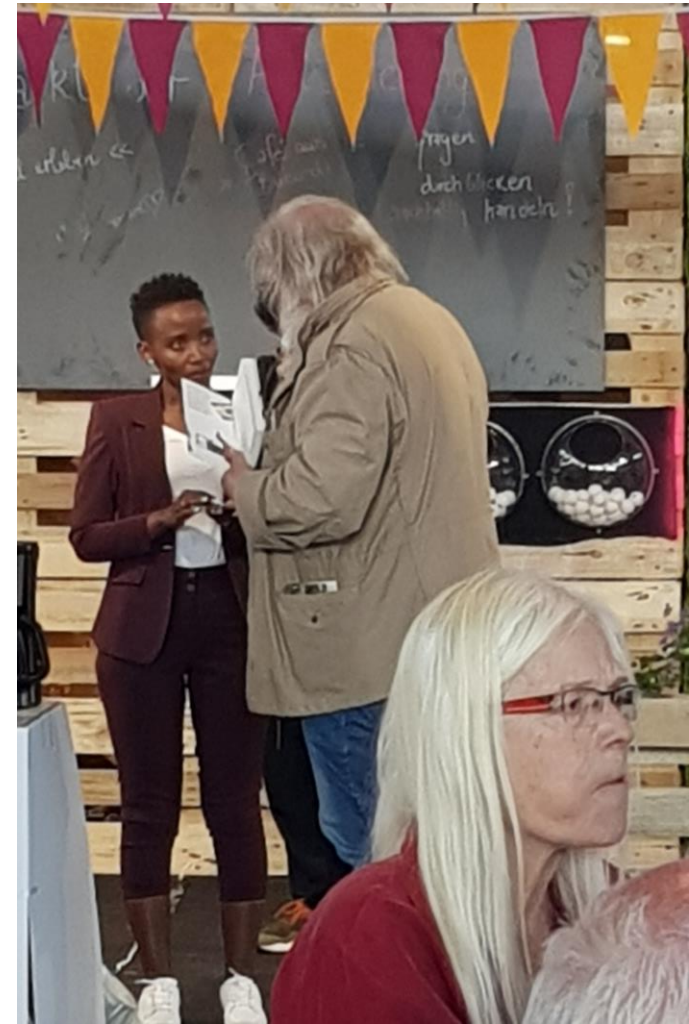
Die Fair Handel Messe in Stuttgart findet am Ende der Osterferien statt.