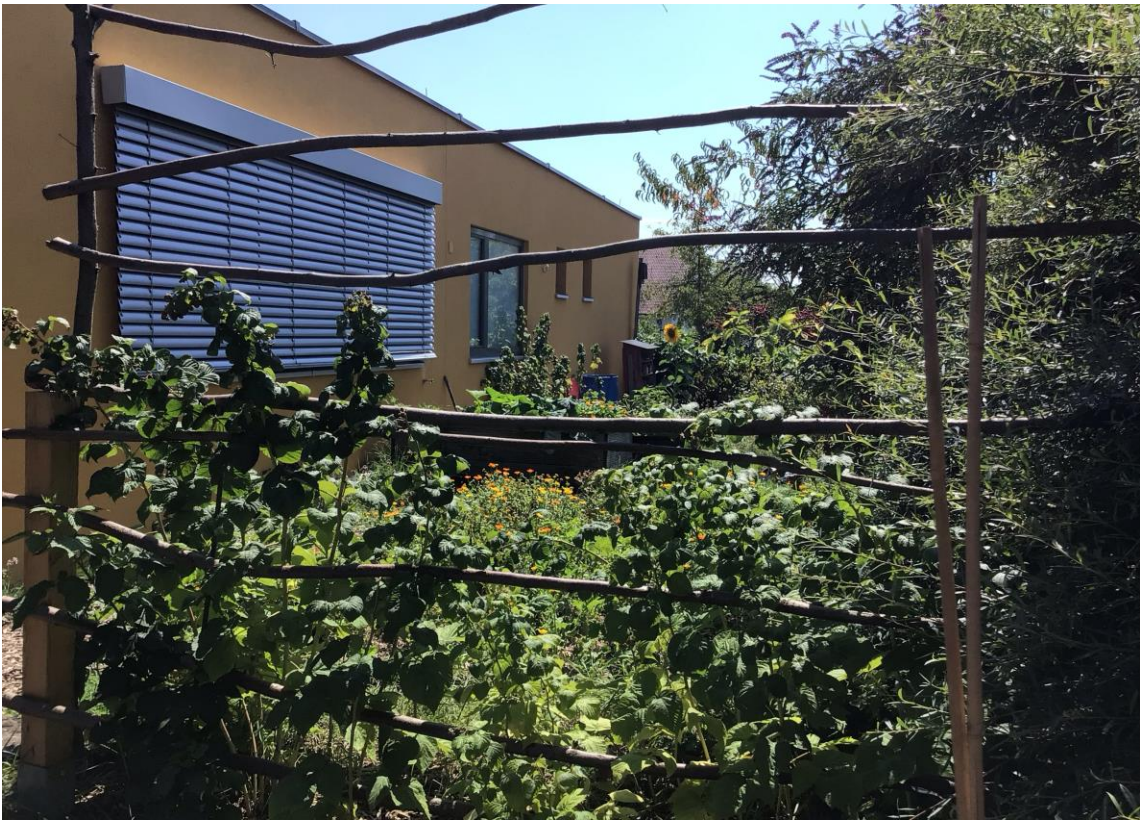
Montessori Schule Herzogenaurach