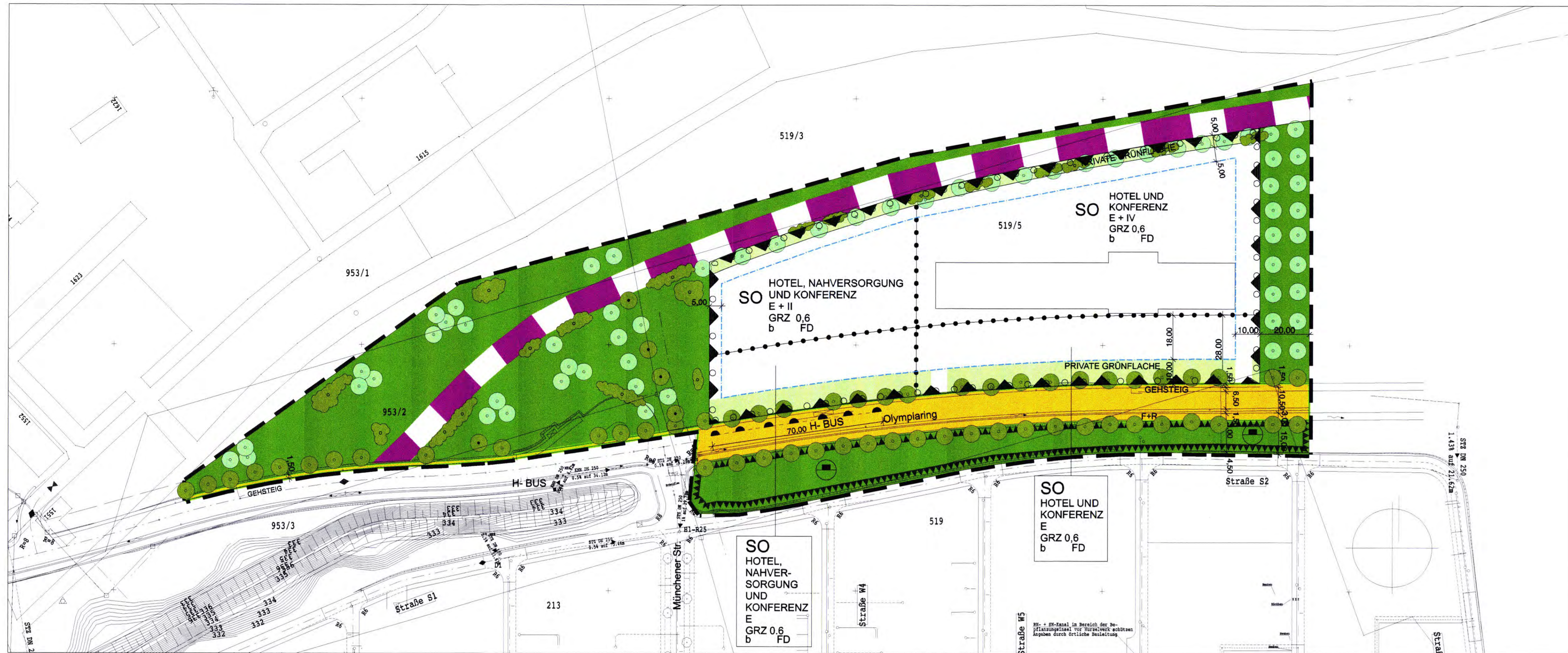
Übersichtsplan M 1:25000