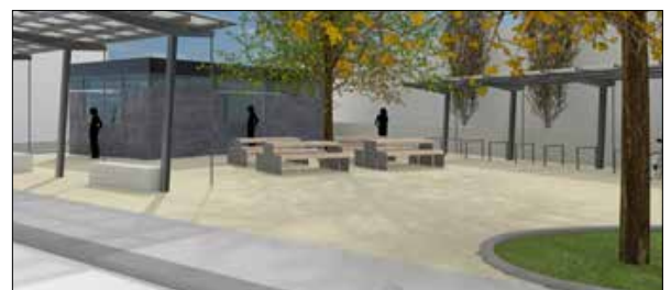
Bildmaterial: Architekturbüro Franke & Messmer

Interessenten mit kreativen Ideen für einen Imbissbetrieb werden gebeten, sich mit ihrem Nutzungskonzept bei der Stadt Herzogenaurach, Bauamt, Marktplatz 11, 91074 Herzogenaurach, Tel. 09132 / 901-214 oder E-Mail: bauamt@herzogenaurach.de zu bewerben. Dort werden auch Fragen beantwortet und bei Bedarf Planunterlagen zur Verfügung gestellt.