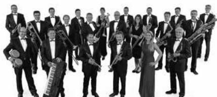
Chic, charmant und sehr musikalisch: die Schaeffler-Bigband

Ein besonderer Dank des Seniorenbeirats geht an Frau Maria-Elisabeth Schaeffler-Thumann und an alle ehrenamtlich Mitwirkenden, die diesen Nachmittag erst ermöglichen!