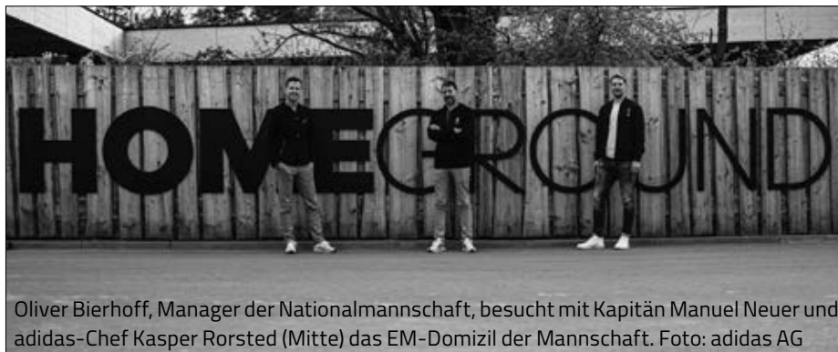
Oliver Bierhoff, Manager der Nationalmannschaft, besucht mit Kapitän Manuel Neuer und adidas-Chef Kasper Rorsted (Mitte) das EM-Domizil der Mannschaft.

... und freut sich über seine neuen Nachbarn: adidas wird für das DFB-Team ab dem 8. Juni 2021 zum „Home Ground“ im Rahmen der Fußball-Europameisterschaft. Diese findet vom 11. Juni bis 11. Juli 2021 in zehn europäischen Städten und einer asiatischen Stadt statt. Herzogenaurach freut sich, das Team von Bundestrainer Jogi Löw begrüßen zu dürfen, und heißt seine neuen Nachbarn herzlich willkommen!