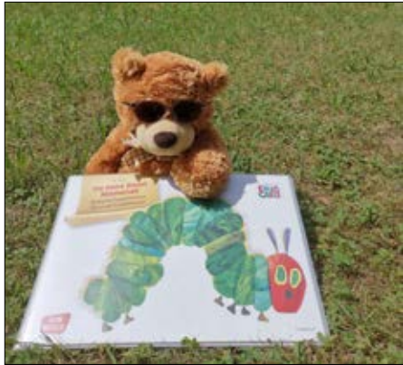
Bücherbärchen im Freien.

Am Mittwoch, 9. Juni 2021, wird um 15.00 Uhr „Jim Knopf und Lukas der Lokomotivführer machen einen Ausflug“ von Beate Dölling gelesen.