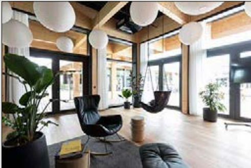
Impressionen aus dem Home Ground auf dem adidas-Campus.

Weitere Informationen auf www.herzogenaurach.de/nationalmannschaft .