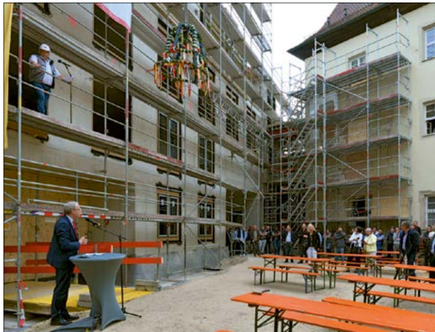
Erster Bürgermeister Dr. German Hacker begrüßt die geladenen Gäste zum Richtfest des Rathausneubaus.

Im Herbst letzten Jahres wurde mit der Grundsteinlegung symbolisch der Start der Rohbauarbeiten fixiert. Am Donnerstag, 16. September 2021, hatte die Stadt Herzogenaurach zum nächsten wichtigen Baufortschritt auf die Rathausbaustelle eingeladen: dem Richtfest. Im Zuge der noch geltenden Corona-Beschränkungen fand die Feier wie bereits die Grundsteinlegung im kleineren, nicht offenen Rahmen statt. Begleitet wurde sie von Vertreter*innen des Stadtrates, den beteiligten Planungsbüros, Vertretern der Bau-firmen, den Projektverantwortlichen und Amtsleiter*innen der Stadtverwaltung.