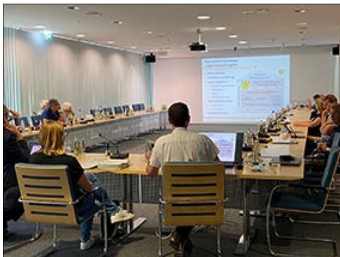
Uwe Petry (im Bild rechts vorne) vom Büro VAR+ stellt die geplanten Schritte zur Erstellung des Radverkehrskonzeptes im Planungs- und Umweltausschuss vor.

Verbesserungsvorschläge und Kommentare zu den ersten Planungsständen abzugeben. Die Ergebnisse aus diesen Beteiligungsmöglichkeiten helfen dem Team von VAR+, die unterschiedlichen Interessen der Nutzergruppen bei der Erstellung des Radverkehrskonzeptes zu berücksichtigen. Der erste Workshop soll im Herbst 2022 stattfinden und wird rechtzeitig beworben. Die Erstellung des Radverkehrskonzeptes wird zudem von der „Arbeitsgruppe Rad Herzogenaurach“ (AG Rad) begleitet, die aus Mitarbeitenden der Verwaltung, Mitgliedern der ehrenamtlichen Agenda-Gruppe zum Radwegeausbau, Parteien sowie weiteren Institutionen und Vereinen besteht. Die AG Rad wird voraussichtlich im Oktober 2022 mit einem ersten Arbeitstreffen ihre Arbeit aufnehmen.