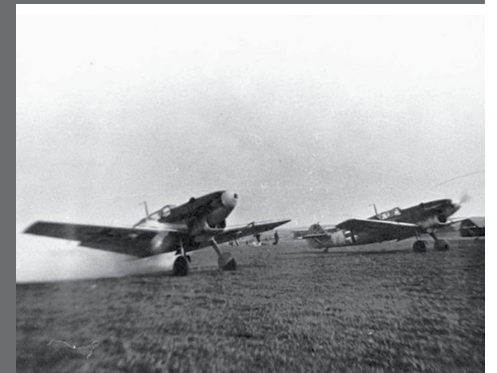
Jagdflugzeuge beim Start, Aufnahme nicht datiert Fighter aircraft on take-off, non-dated photograph

Although the Allied Forces had detailed knowledge of these military facilities, they refrained from targeting the air base in their bomb attacks. And when the German forces withdrew from the area, orders to blow up the base were not followed. The Allied combat squads took over the air base virtually intact on April 16, 1945.