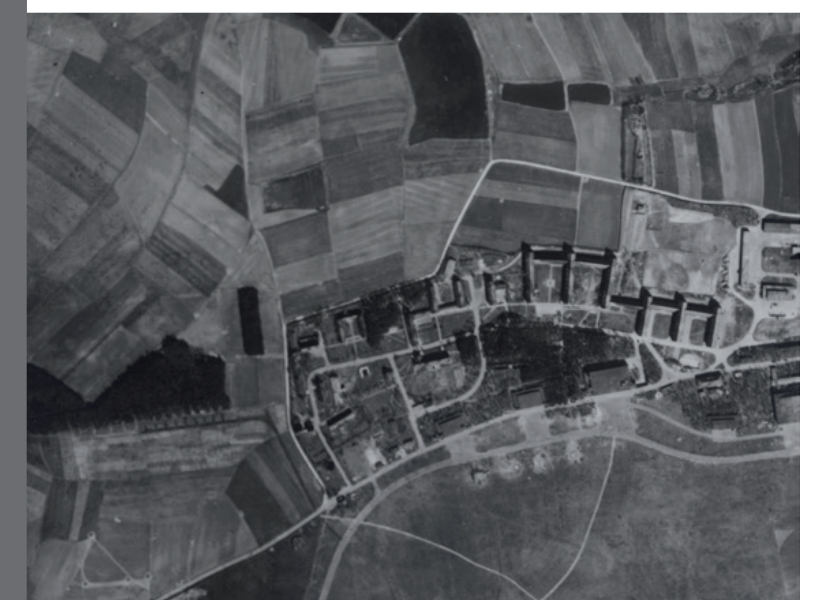
Aufklärungsfoto der alliierten Streitkräfte, 8. April 1945 Reconnaissance photograph taken by the Allied Forces, April 8, 1945