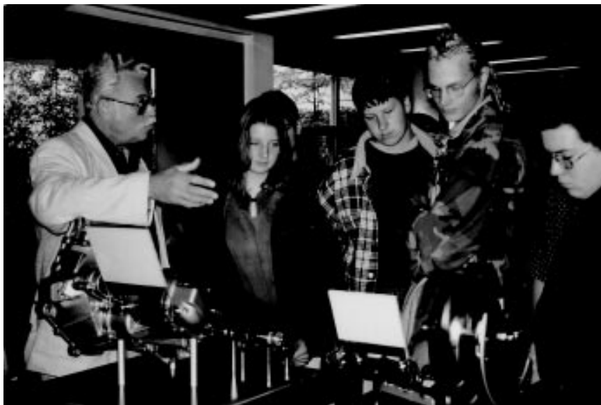
24 Schulklassen und viele interessierte Bürgerinnen und Bürger besuchten die Ausstellung „50 Jahre Schaeffler-Werke in Herzogenaurach“, die im September 1997 im Foyer des Rathauses zu sehen war.

Alte Erfahrungen und neue Marktbeobachtungen begünstigten den Start. In Schwarzenhammer hatten ehemalige Weber aus Katscher begonnen, Handwebstühle zu bauen. In der Folge wurde die Teppichweberei Schwarzenhammer