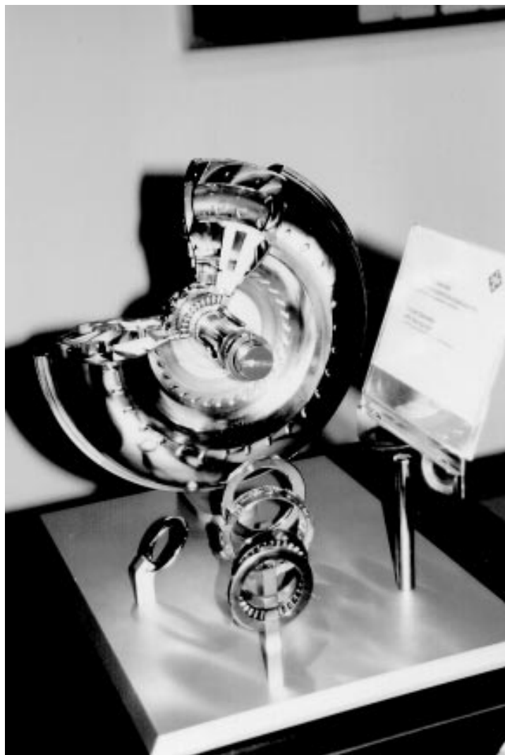
„Überall, wo sich Wellen oder Räder drehen sind INA-Lager mit dabei“

Jetzt wurde die unterfränkische Wälzlagermetropole in Schweinfurt mit oberster Genehmigung entlastet und gleichzeitig wurden in der Schlosserei zahlreichen Lehrlingen einträgliche Gesellenstellen geboten.