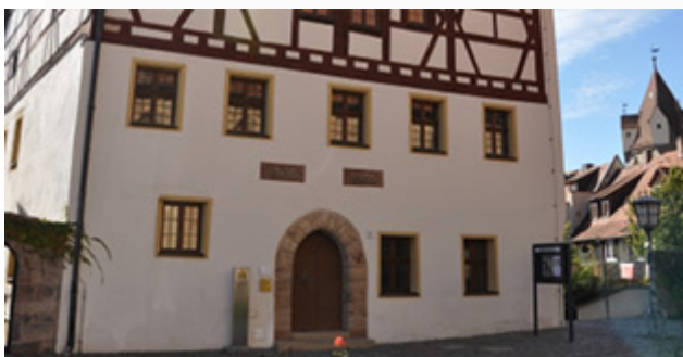
Stadtmuseum Herzogenaurach Kirchenplatz 2